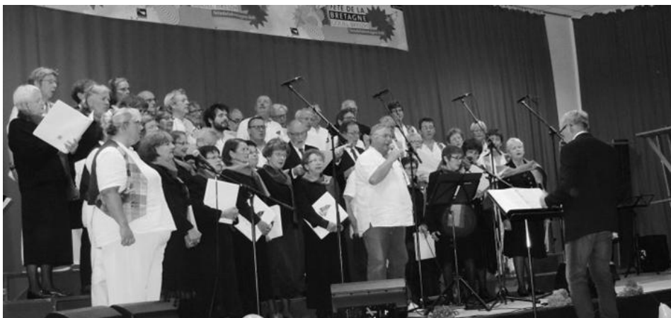
KAN AR VAG et ECHAPPEE BELLE le 18 octobre 2015 à PLOUZANE