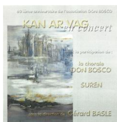
CD 17 titres (12 KAV)