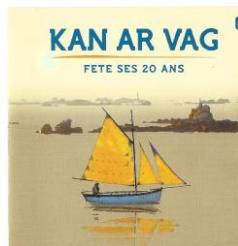
CD 18 titres

La chorale CANTAREE ( jf.faujour@wanadoo.fr ),